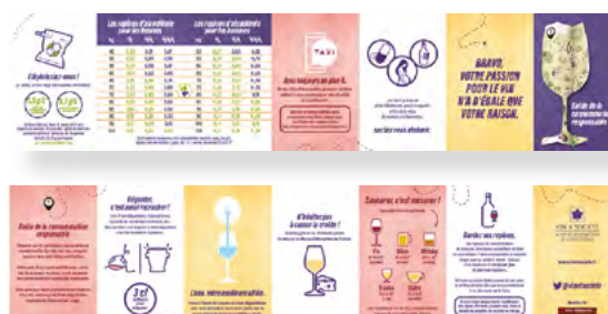
Un guide de la consommation responsable qui rappelle les repères d'alcoolémie, les seuils de consommation à moindre risque, et donne des conseils de modération.