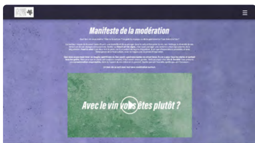
Un Manifeste de la modération qui porte les valeurs de la filière vin en faveur de la consommation responsable. Quelle que soit l'assiette, quelle que soit l'occasion, souvenez-vous que : « l'accord parfait, c'est la modération » !