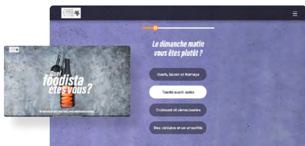
Un quiz « Quel foodista êtes-vous ? » qui invite l'internaute à découvrir son/ses profils foodista et quel modéré il est !