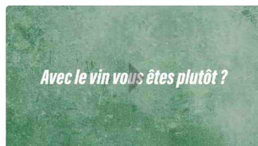
Une vidéo de présentation de la campagne à partager sur les réseaux sociaux